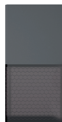
93134 Noir Anthracite